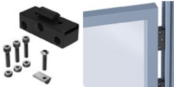
Set Hubtür-Führung Set Lift Door Guide